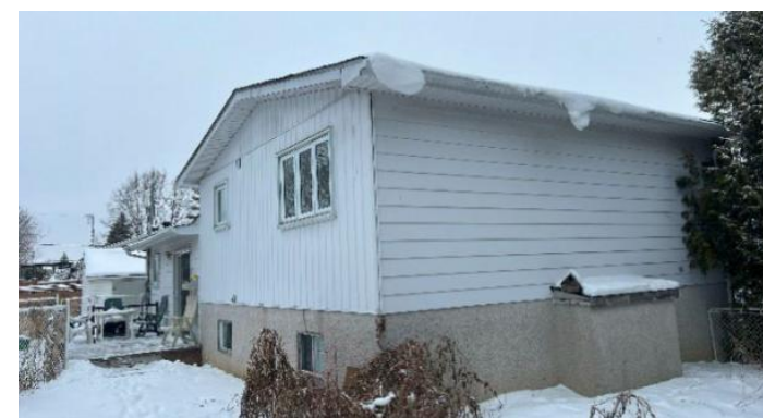
Habitation unifamiliale de structure isolée construite en 1978.