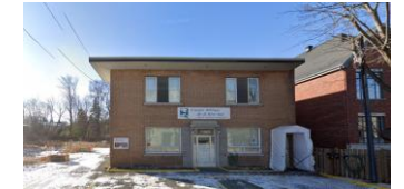
530 et 532