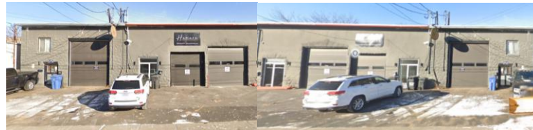
575 et 577