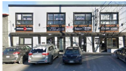
593, 597 et 599